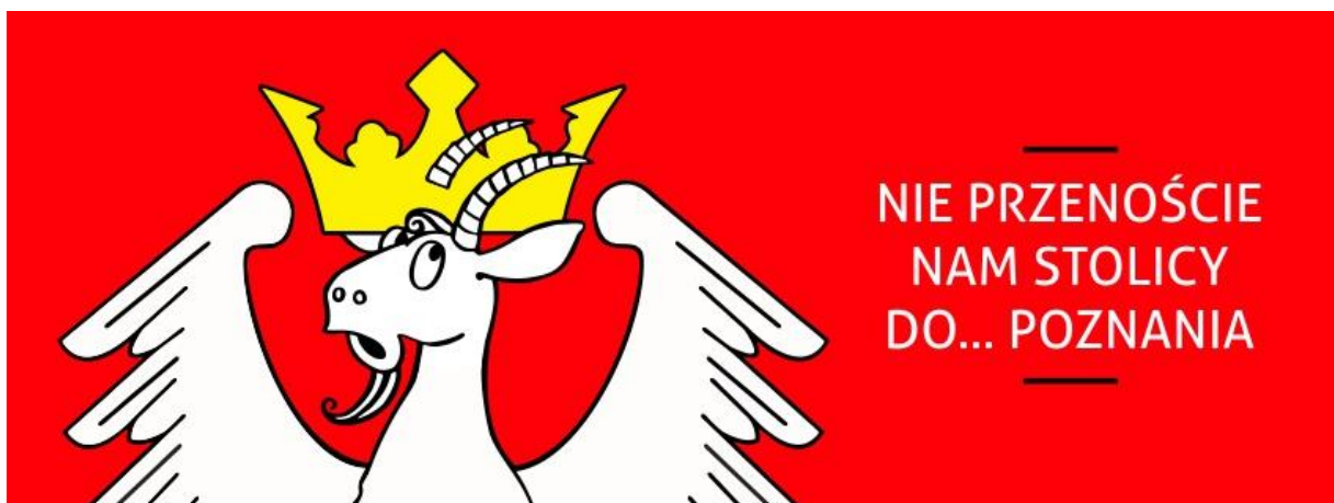
Plakat kampanii społecznej pn. „Nie przenieście nam stolicy do... Poznania”

Z tego oburzenia na kampanię kreatywną Inei, w gnieźnieńskim starostwie zrodził się pomysł na kampanię promującą miasto w opozycji do Poznania. Społeczną kampanię „Nie przenieście nam stolicy do... Poznania” promował plakat, na którym uskrzydłony poznański koziołek ze zdziwieniem, a może nawet przerażeniem, zauważał nad swoją głową koronę. Akcja miała na celu zachęcenie mieszkańców i sympatyków Grodu Lecha do informowania władz powiatu o wszelkich tego typu manipulacjach. Każda osoba, w razie reakcji, może liczyć na specjalnie przygotowany zestaw upominków promocyjnych Powiatu Gnieźnieńskiego.